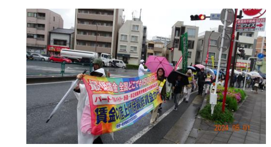
(最賃掲げ・元気に沢渡公園へ!)