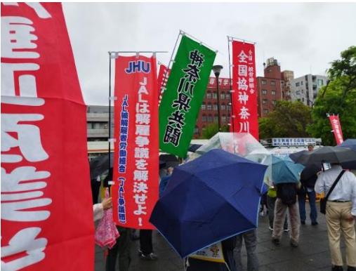
(集会が始まるも雨で傘が開花)