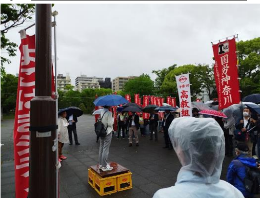
(簡易のビールケースの演壇で)