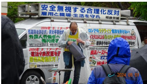
(恒例のマジックショー。手元の袋からは何が出るか?さて)