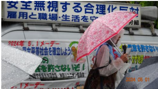
(こんな豪雨メーデーは聞いてないよ)