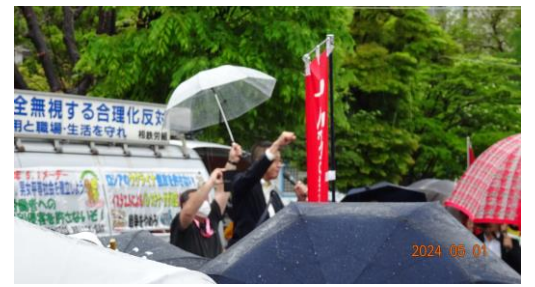
(閉会のあいさつと団結ガンバロー)