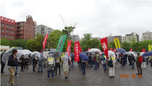
(神奈川メーデーに参集する仲間)

そんな中、大企業の内部留保は拡大、春闘の成果は極一部の労働者にしか還流されていません。中小企業春闘に、そして10月改正される最低賃金アップの取り組みは、暮らしを守るための切実な取り組みです。働くものが安心して暮らせる社会に向け手を組み団結して闘いましょう。