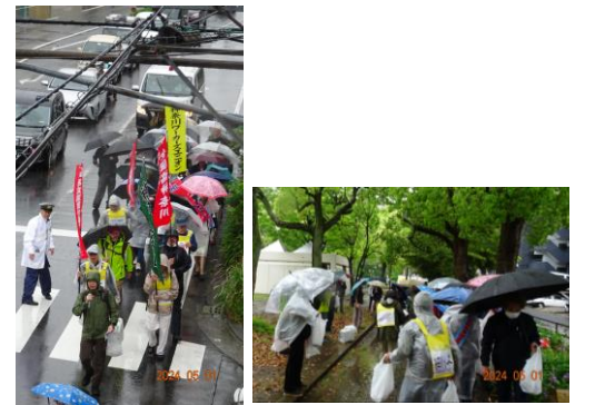
(県共闘旗先頭で) (沢渡中央公園にて総括集会後解散)