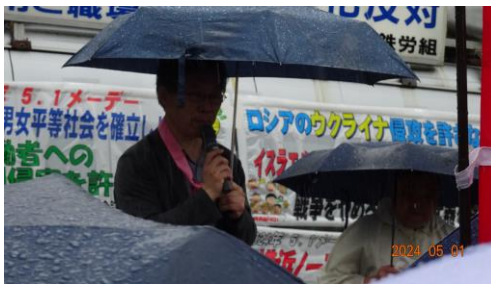
(各労組からの発言)