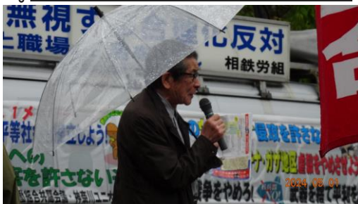
(福島闘いはまだ終わってはいない。福島かながわ訴訟団長挨拶)