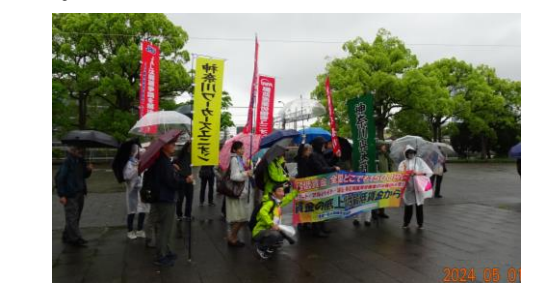
(雨も小降りにデモ出発。)